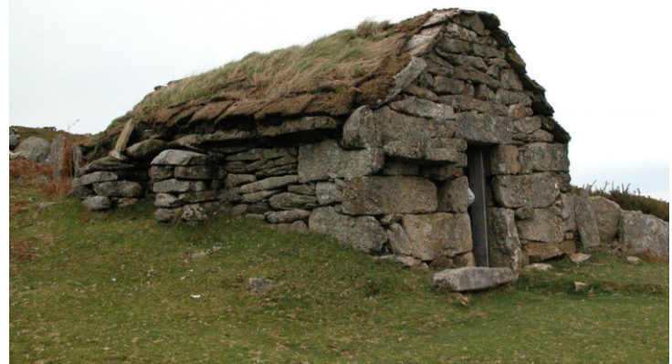
Chozo de Mangoeiros

O ancestral aproveitamento gandeiro da serra do Suído deixou ao longo de toda ela numerosas pegadas do facer e do loitar dos seus habitantes, da adaptación da súa vida ao medio e do aproveitamento dos elementos da contorna para ter deles o mellor rendimento. As mostras atopámonas nas construcións realizadas en diferentes lugares para protexer e gardar o gando e acoller á xente –chozos, sesteiros, curráis,...- e nas construcións para controlar e eliminar aos seus enemigos dos que entre todos destacan, polo seu labor, tamaño e curiosidade; os foxos do lobo dos que douso, grazas ao traballo de conservación da veciñanza, se atopan en bo estado e é bastante doado achegarse a coñecelos polas pistas abertas no monte.