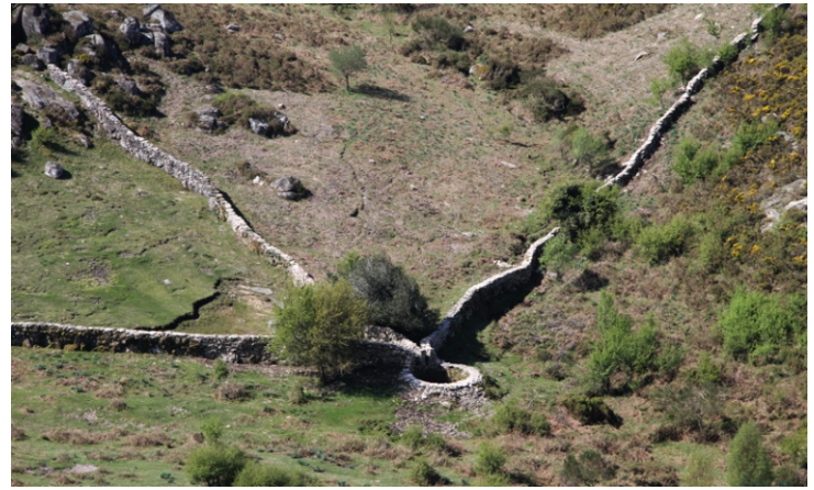
Foxo do Lobo de Portela das Travesas, coñecido tamén como A Forca do Lobo. Formado por tres paredes converxentes, a do oeste de 100 m de lonxitude, a central de 60 m, e a do norte de 125 m que converxen en dous corredores de 60 cm de ancho que desembocan nun pozo e 5 m diámetro.