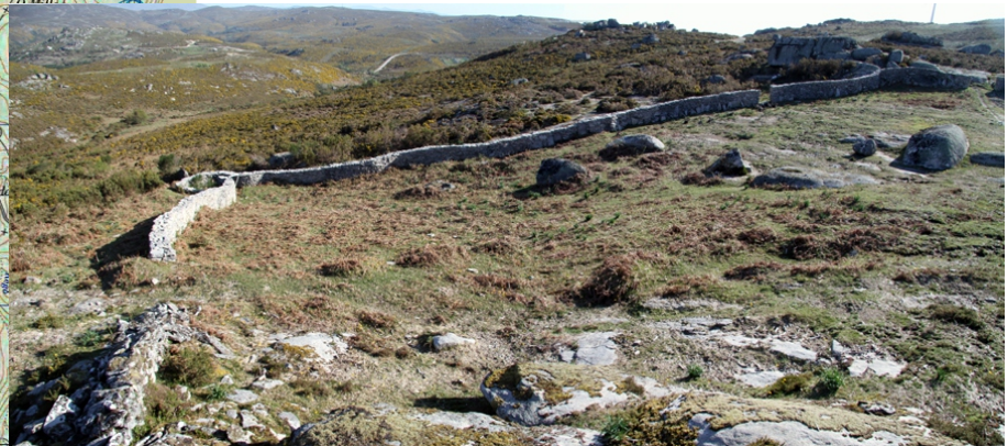
Foxo do lobo de Pigarzos, formado por dúas paredes, a do leste de máis 280 m e a outra duns 150 m.