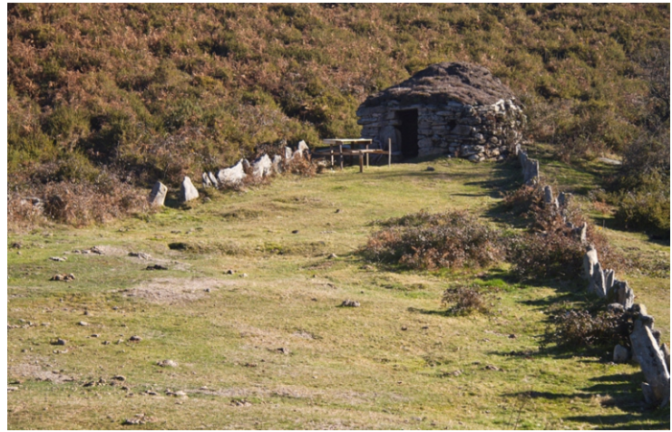
Chozo de Prado, nun dos extremos do Foxo do Lobo de Portela das Travesas